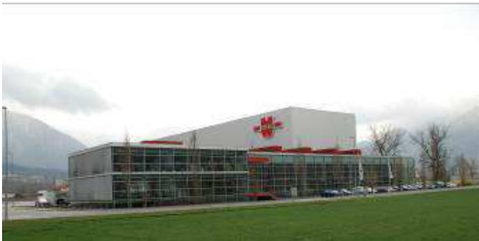
Ansichten des bestehenden Lagergebäudes in Landquart